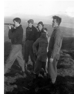
1935-1950. Hópur karlmanna úti í náttúrunni. Einn þeirra er að skjóta úr byssu.