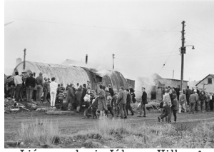
1963. Bruni við Blesugróf. Fólk stendur og fylgist með þegar hús og braggar brenna við Blesugróf.