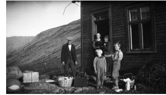
1920-1930. Hópur fólks stendur fyrir utan heimili, sennilega í sveit. Gæti verið á Vestfjörðum.