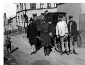
1930-1935. Klapparstígur, vinnuflokkur við sorphirðu í Reykjavík. Ungur drengur stendur hjá, virðist vera í sendiferð.