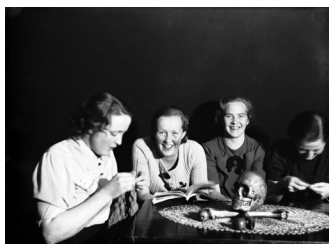
1933-1940. Fjórar konur sitja við borð, tvær þeirra vinna að saumaskap, ein þeirra er að lesa. Á miðju borðinu eru mannabein, hauskúpa og leggír. Á umslaginu stendur: Ýmsar filmur 1933.