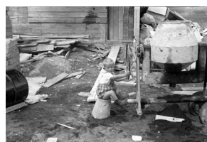
1980-1960. Ungur drengur situr við steypuhrærivél.