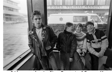
Ljósmyndari: Jim Smart. 19. apríl, 1983. Unglingar á Hlemmi. Birt í Helgarpóstinum með fyrirsögninni: Íslensk dýragarðsbörn.