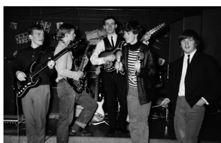
Sennilega um 1965. Dægurlagahljómsveit. Ungir menn í hljómsveit, sumir eru með bitlaklippingu.