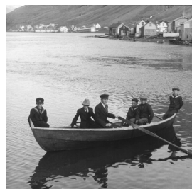
1925-1929. Ungir piltar á arabát frá Seyðisfirði.