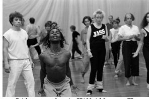
Júlí 1985. Dans og danskennsla í Kramhúsinu.