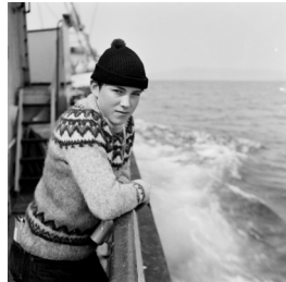
1955-1964. Æskulýðsráð Reykjaíkur. Veidiferð með M/B Sæbjörgu. Ungur drengur í lopapeysu. Sjóvinnunámsskeið.