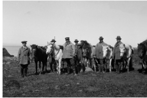
1915-1935. Ferðalag á hestum, sex fullorðnir karmenn og ungur drengur standa við hesta.