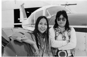
1979. Tvær grænlenskar stúlkur koma til Íslands til að vinna.