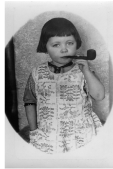
1928-1930. Ung stúlka með pipu föður síns í munnvikinum.