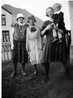
1915-1925. Þrjár ungar konur og litíð barn standa í húsagarði, sennilega á Ísafirði.