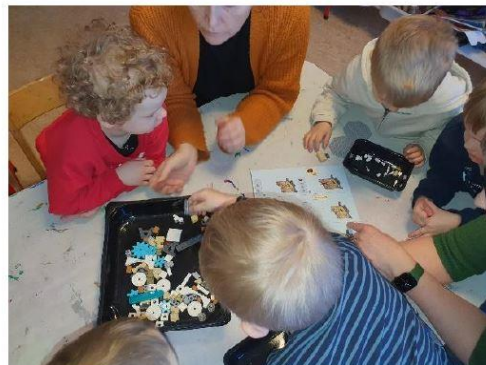
Mynd 3 og 4. Unnið að kastalabyggingu í Engjaborg

Fyrir háskólasamfélagið er afar mikilvægt að hafa beina tengingu inn á vettvang og geta miðlað niðurstöðum af vettvangi í kennslu. Mikilvægt að sjá hvernig hægt er að innleiða hugmyndafræði leikskóla í daglegt starf og hvaða leiðir eru færar. Einnig er verðmætt að geta safnað gögnum af vettvangi og skrifað um þau fræðigreinar. Það hefur verið gefandi að fylgja samstarfi fjögurra leikskóla og að kynnast starfi þeirra. Samstarf leikskóla og háskóla er og ætti að vera gagnvirkt og að koma báðum aðilum til góða. Áhugavert hefur verið að fylgjast með þeim áskorunum sem vettvangur er að glíma við, t.d. COVID-19, skort á leikskólakennurum, styttingu vinnuviku, og aukinni fjarveru kennara af deild vegna aukinna undirbúningstíma.