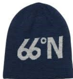
66 Norður flík