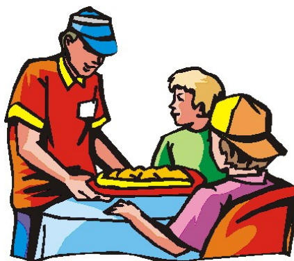
Út að borða