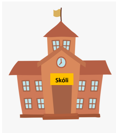
Fara í skóla