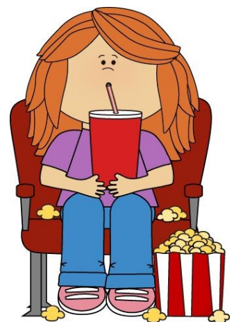
Fara í bíó