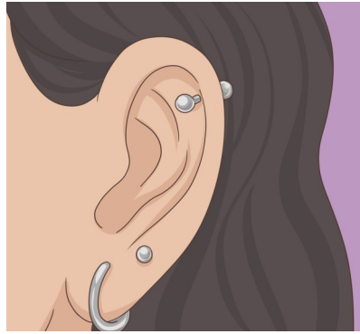
Göt í eyru