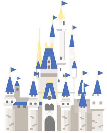
Búa í höll