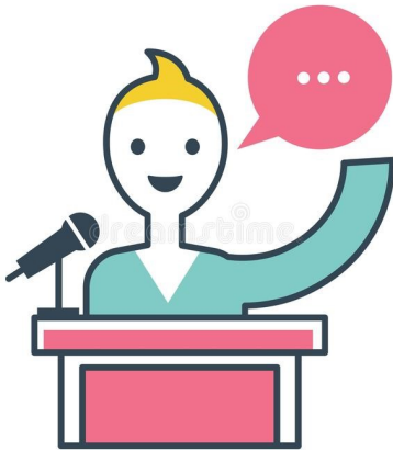
Segja skoðun sína