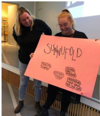
Mynd 3. Kynningar leikskólanna á áhersluþáttum verkefnisins