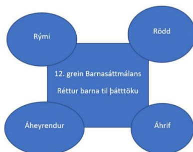
Mynd 1. Líkan Lundy (2007)

Í þessum verkhluta var líkan Lundy (2007) kynnt um þátttöku barna (sjá mynd 1). Ein leið til að greina þátttöku barna í leikskólastarfi er að styðjast við líkan Lundy (2007) sem byggir á fjórum viðmiðum. Það fyrsta snýst um að gefa börnum tækifæri til að mynda sér skoðanir og tjá þær. Annað viðmiðið fjallar um þátt starfsfólksins í að auðvelda börnum að tjá skoðanir sínar, veiti þeim viðeigandi upplýsingar og greiði fyrir því að þau láti í ljósi skoðanir sínar. Þriðja viðmiðið felst í að tryggja beri að hlustað sé á skoðanir barna, þ.e. að þeim sé komið á framfæri við aðila sem geta komið skoðunum þeirra í framkvæmd og fjórða viðmiðið snýst um þau áhrif sem raddir barna geta haft og að þær séu teknar alvarlega og brugðist sé við þeim.