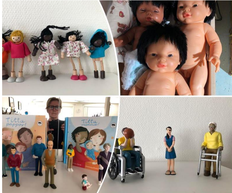
Mynd 2. Dúkkur