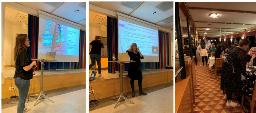
Mynd 6. Heimsókn í leikskóla í Stokkhólmi og fyrirlestrar haldnir

Stokkhólmsferðin var liður í að ljúka fyrsta vetri verkefnisins og skoða sérstaklega starf leikskóla sem vinna með virkt hlutverk starfsfólks í leik barna, námsumhverfið og barnahópin. Tveir leikskólar voru heimsóttir og hlustað á fyrirlestra um félagslega sjálfbærni í leik og virkt hlutverk starfsfólks í leik barna (sjá mynd 6). Tekin voru fyrstu skrefin í að undirbúa frekari samvinnu leikskólanna veturinn 2023-2024 með reglulegum heimsóknum starfsfólks sem styrktar verða af Erasmusplús og sameiginlegri þemavinnu leikskólanna um leik barna